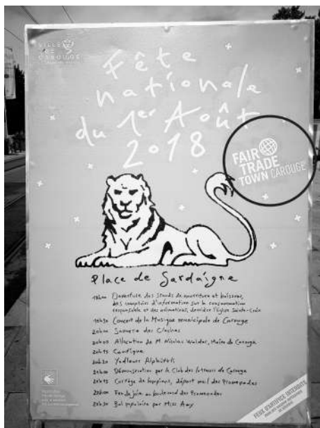
Affiche communale annonçant les festivités du 1er août 2018 avec la mention « Fair trade town Carouge »